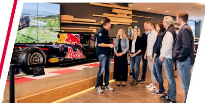
RED BULL RING / WELCOME CENTER