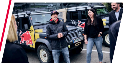
DRIVING CENTER 3 GRUPPEN MIT JE 10 PERSONEN

13:00 – 14:00 UHR BRIEFING UND EINTEILUNG