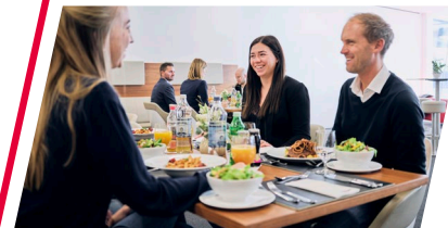
BULLS LANE RESTAURANT PREIS: 30 x € 31,00 ..... € 930,00