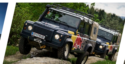
4WD TEST TRACK PREIS: 5 x € 760,00 ..... € 3.800,00 PERSONAL INSTRUCTOR ..... € 661,20