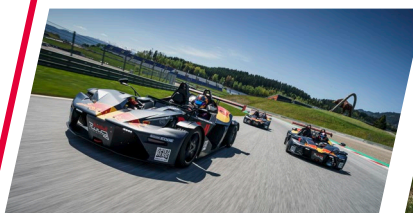
DRIVING CENTER PREIS: 5 x € 950,00 ..... € 4.750,00 PERSONAL INSTRUCTOR ..... € 661,20 PERSONAL SUPPORT ..... € 421,20

14:00 – 17:00 UHR KTM X-BOW ODER PORSCHE 718 S