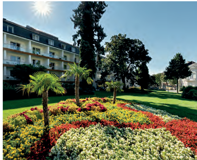
Der Garten des „At the Park“ Hotels in Baden bei Wien - auch außerhalb von Golfplätzen gibt es talentierte und fleißige Greenkeeper - nur nennt man sie hier „Gärtner“

Ich möchte Euch auf eine Reise zu zwei dieser ausgezeichneten Seminarhotels für ganz besondere „Golf Getaways“ mitnehmen. Golfbegeisterte, die auch die vielfältigen Möglichkeiten einer Stadt schätzen, kommen im „At the Park“ Hotel in Baden bei Wien voll auf ihre Rechnung. Direkt am wunderschönen Kurpark gelegen, spürt man schon beim ersten Schritt ins Haus die ganz besondere Atmosphäre und das außergewöhnliche Ambiente. Design- und Kunstliebhaber können sich im „At the Park“ im wahrsten Sinn des Wortes auf eine Entdeckungsreise begeben. Viele Einrichtungsgegenstände und Bilder sind Unikate und wurden mit großer Sorgfalt und viel Liebe zum Detail zusammengestellt. Will man im Vintage-Stil der 70er-Jahre wohnen oder vielleicht doch in einer originellen Themen-Suite? Schlafen wird man in den wunderbar bequemen Betten auf alle Fälle gut.