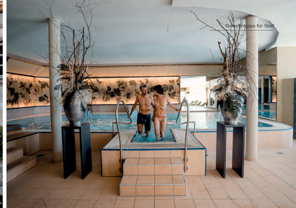
Geheimtipps für Golf