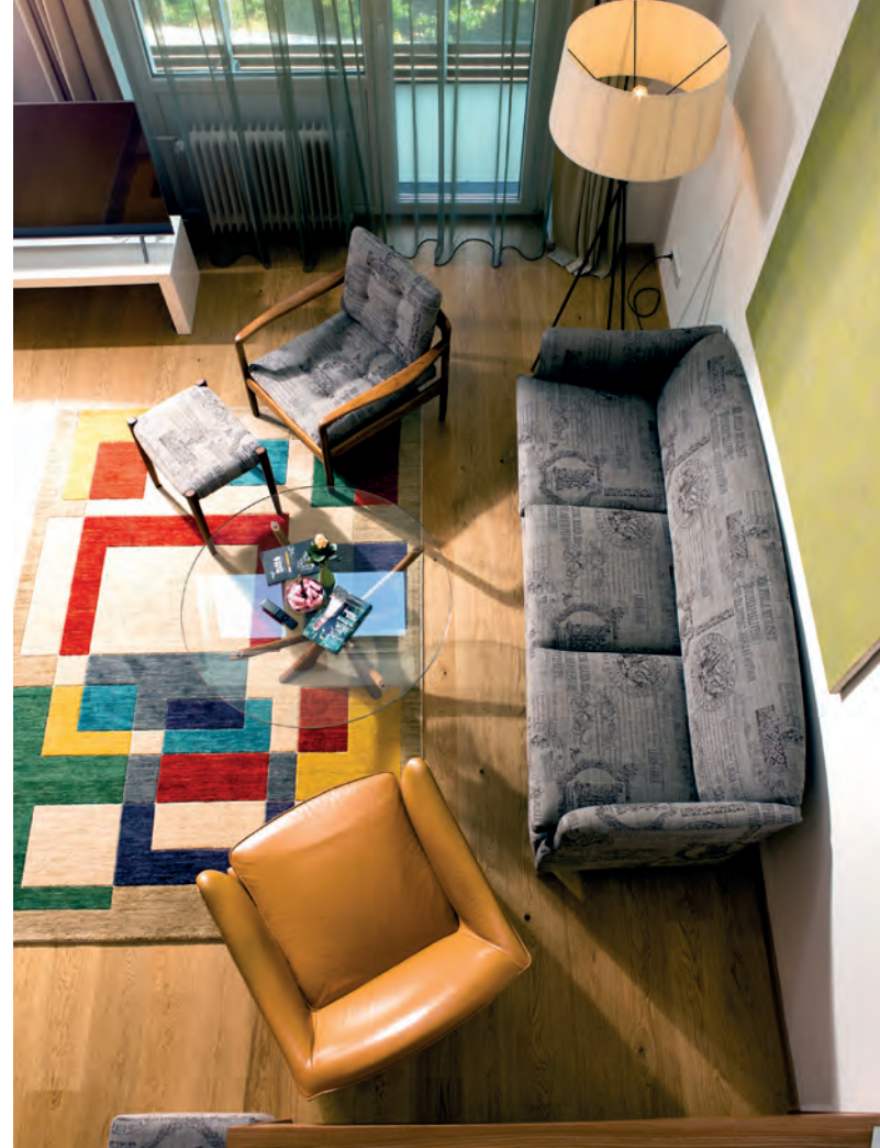
Das „At the Park“ in Baden bietet eine große Auswahl an sehr unterschiedlich gestalteten Zimmern.

Irgendwann muss man aber dann doch die Heimreise antreten. Für den Abreisetag buche ich gerne den Golfplatz Linsberg. Dieser lässt sich gut in rund drei Stunden spielen und nach einem flotten Spiel mit viel Bewegung fällt auch eine längere Autofahrt viel angenehmer aus. ►