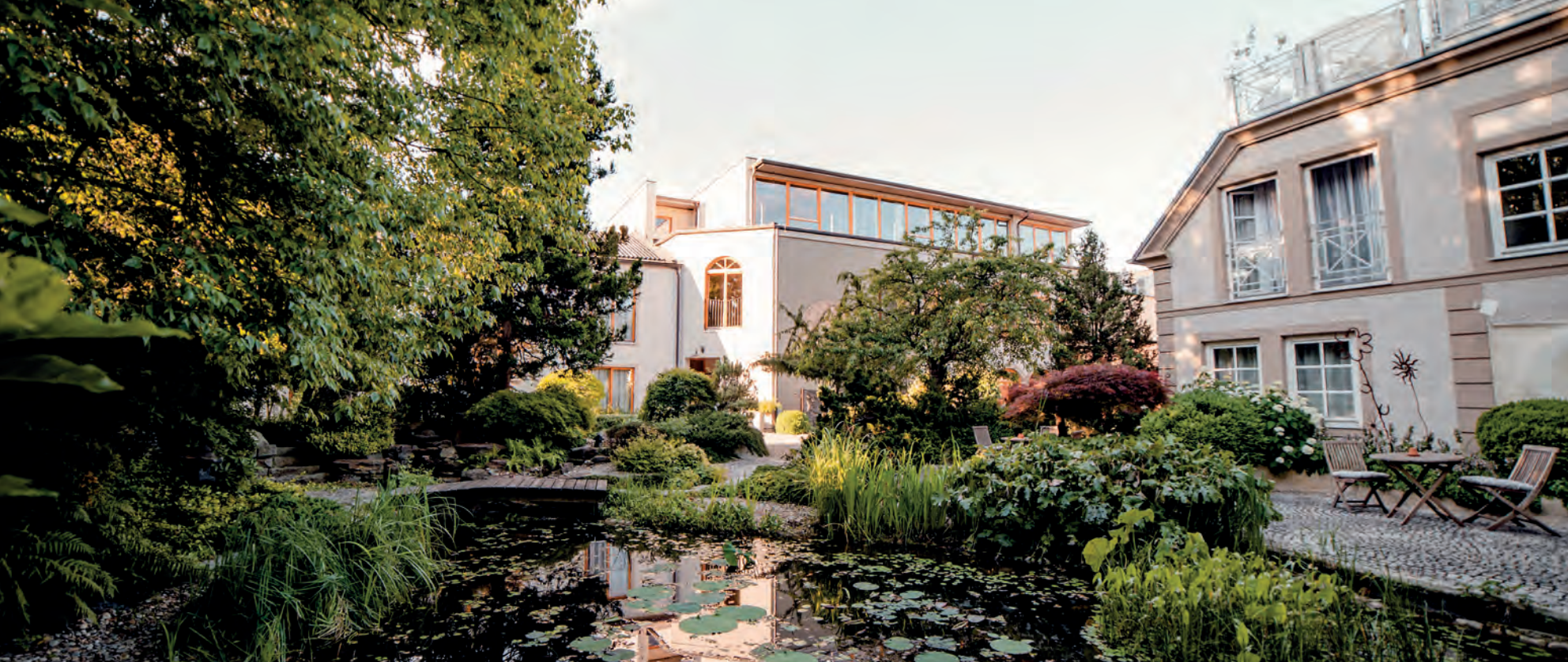
Im Sommer lädt der Naturschwimmteich im Garten Hotel Ochsenberger zur Entspannung und Abkühlung nach der Golfrunde.